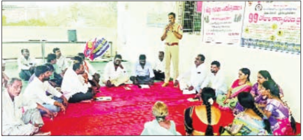
మోటకొండూర్, ఏప్రిల్ 13, ప్రభాతవార్త:

వాహనదారులు హెల్మెట్, సీటు బెల్టులు తప్పనిసరిగా వాడాలని లేనిచో ప్రమాదాలకు గురై మరణిస్తే వారి కుటుంబాలలో తమపై ఆధారపడిన వ్యక్తులు అనాధలుగా మారే అవకాశాలు ఉంటాయిని ఎస్పీ డి అశోక్ తెలిపారు. ఆయన మోటకొండూర్ మండలంలో ప్రజా పాలన ప్రగతి ప్రణాళికలో భాగంగా మండలంలోని అన్ని గ్రామాలలో గ్రామ సభలు ఏర్పాటు చేయడం జరిగింది దని, విలేజ్ రోడ్ సెఫ్టీ కమిటీ ఏర్పాటు చేసి రోడ్ బద్రతకు సంబంధించిన ప్రతిజ్ఞ చేయించి, గ్రామసభలలో తీర్మానాలు చేయించినట్లు తెలిపారు. చిన్నపిల్లలకి డ్రైవింగ్ నుంచి నిర్మూలన, ద్వచక్ర వాహన దారులు కచ్చితంగా హెల్మెట్ ధరించాలని, అలాగే కారులో ప్రయాణించే టప్పుడు సీట్ బెల్ట్ ధరించాలని తీర్మానాలు చేసి ప్రతిజ్ఞ చేయడం జరిగిందని, అన్ని ప్రభుత్వ కార్యాల యాల ద్వారాలలో మరియు పెట్రోల్ బంక్ లలో హెల్మెట్ లేకపోతే ప్రవేశం లేదు బోర్డ్ ఏర్పాటు చేసినట్లు, గ్రామాల సరిహద్దులలో రోడ్డు ప్రక్కనే పెద్ద పెద్ద గుంతలు బావులు, రోడ్డు కనిపించ కుండా ఉన్న చెట్లు తొలగించడం కోసం వాటిని గుర్తించి హెచ్చరిక బోర్డులు పెట్టించాలని కోరినట్లు అశోక్ తెలిపారు. ఈ గ్రామ సభలలో వివిధ గ్రామాల సెక్రటరీలు, సర్పంచులు, వార్డు మెంబర్స్ మిగతా ప్రభుత్వాధి కారులు, ఆశావర్ధన్, గ్రామస్తులు పాల్గొన్నారు.